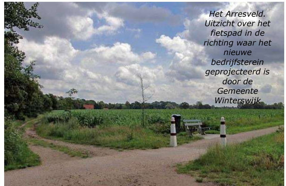
Het Arresveld. Uitzicht over het fietspad in de richting waar het nieuwe bedrijfsterein geprojecteerd is door de Gemeente Winterswijk

Vanwege deze mogelijke gevolgen vindt het bestuur het gewenst en noodzakelijk haar visie te bespreken met de experts en echt geïnteresseerden onder de familieleden (warme en koude kant!), om gebruik te maken van de aanwezige kennis en ervaring en het draagvlak hiervoor te vergroten.