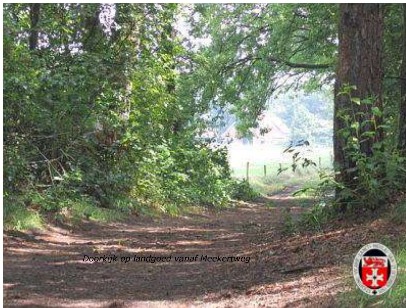
Doorkijk op landgoed vanaf Meekertweg

Hierbij het verzoek het bestuur te helpen het (email) adressenbestand actueel te houden. Stel bij verhuizing ook het secretariaat even op de hoogte!