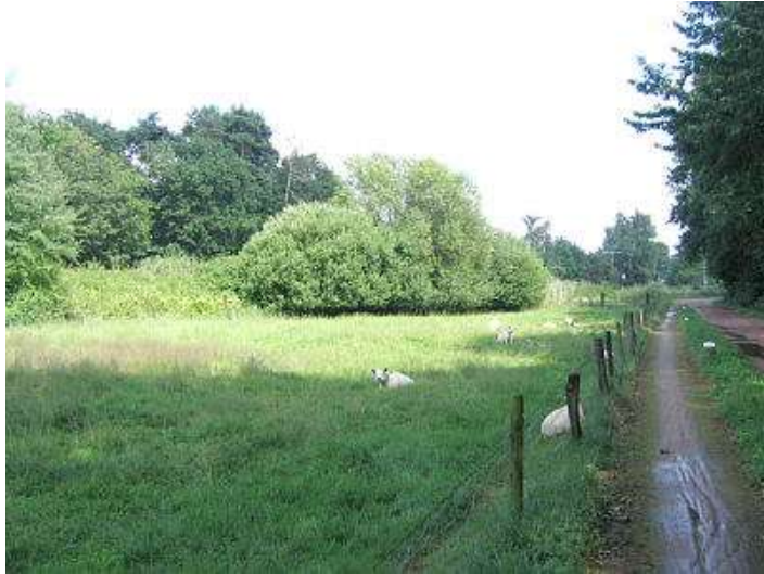
Schapen op Landgoed de Batenborgh

denken over de te voeren landgoedstrategie van de Vicarie, zal er in het laatste weekend van april een aantal activiteiten worden georganiseerd in Winterswijk. Zie verder meer hierover.