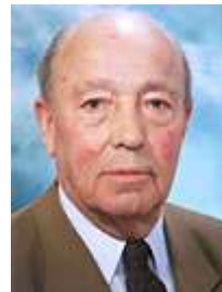
De 26 e collator sinds 1501

Naar verwachting zullen de nieuwe toelagen tegen de zomer van 2009 worden toegewezen. Studenten die in 2008/2009 staan ingeschreven aan een hbo-school, universiteit kunnen tot 1 mei 2009 een aanvraag indienen.