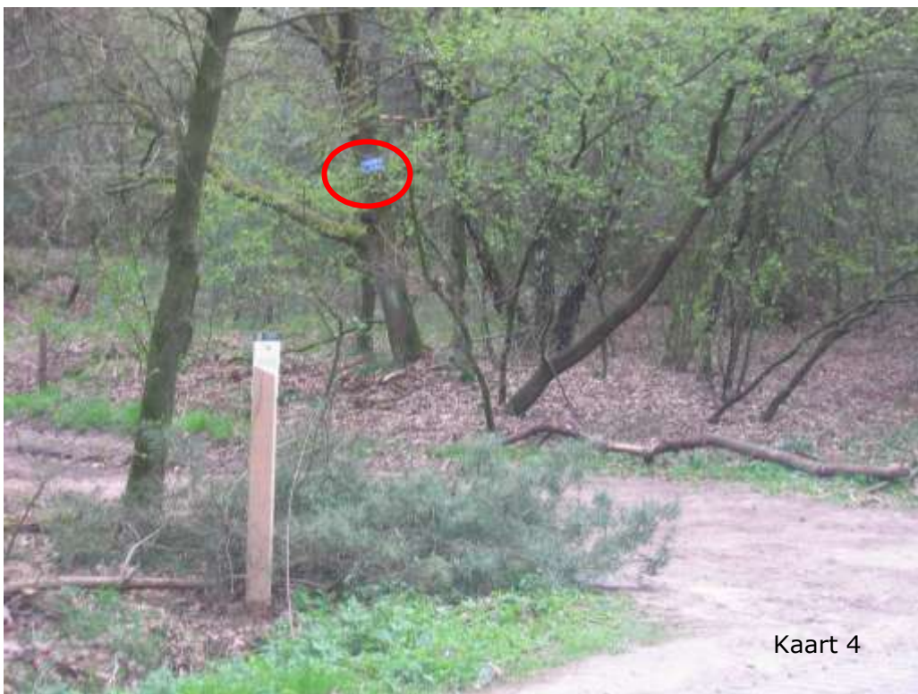
Toegang via Meekertweg naar weiland tbv pachter