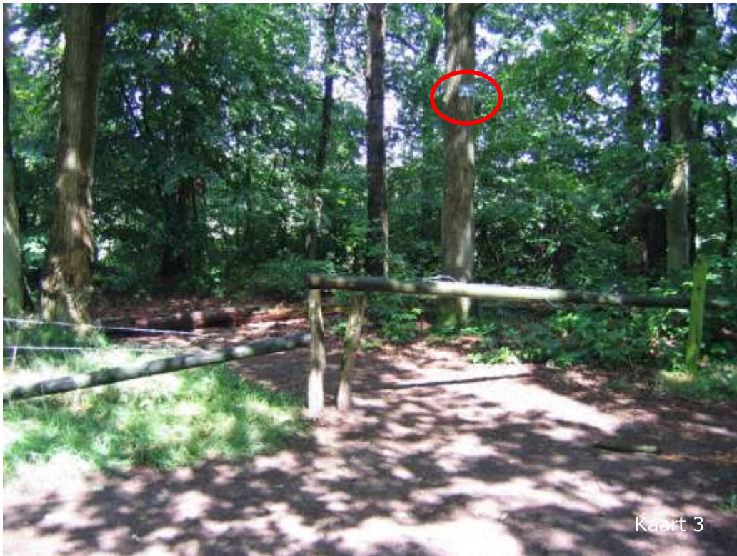
(laatste provisorische reparatie afrastering in mei 2007)